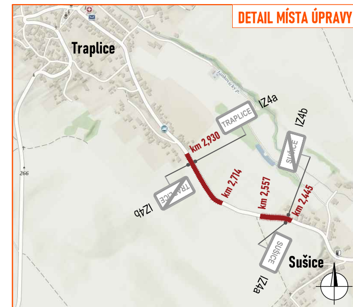
SCHÉMA PRACOVNÍHO MÍSTA U SUŠICE